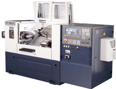
SB/MC – 840 D