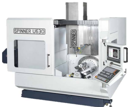
U5-1530 – TNC 640