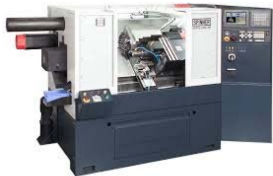
PD/GGS – 840 D