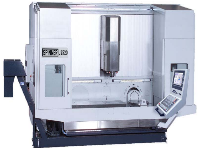
U5-2520 – 840 D