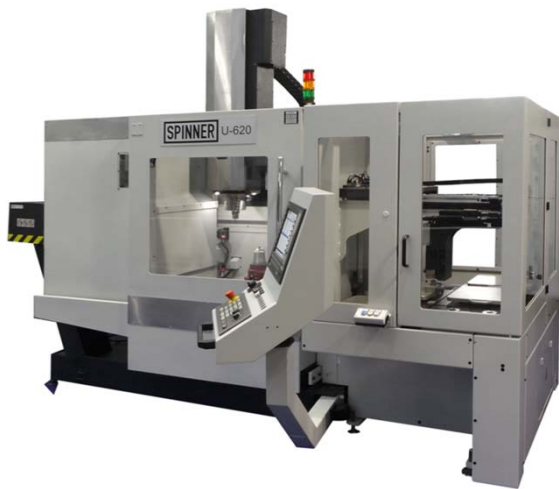
U5-620 – TNC 640 AUTOMATION