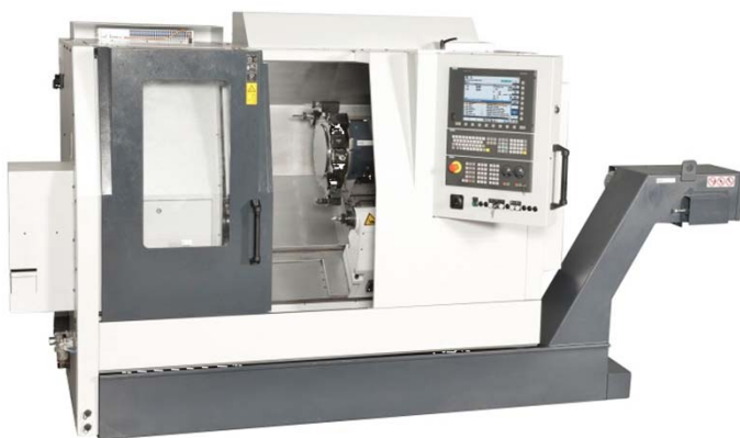
TC 600 MCY – 840 D